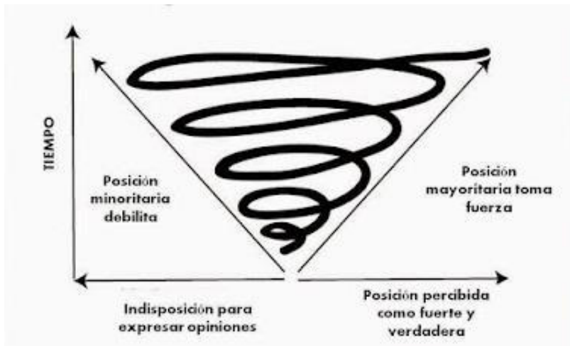
Figura 2. La espiral del silencio.

Nota. Adaptado de Teoría de la espiral del silencio de Elisabeth Noelle-Neumann, (Imagen), teorías y modelos de la comunicación.