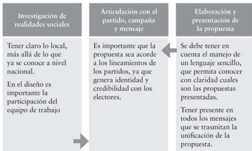
Figura 4. Elementos para la elaboración de propuestas.

Nota. Tomado del Manual de marketing político: Estrategias para una campaña exitosa. (Calderón, Arias, Granados, & Enciso, 2017).