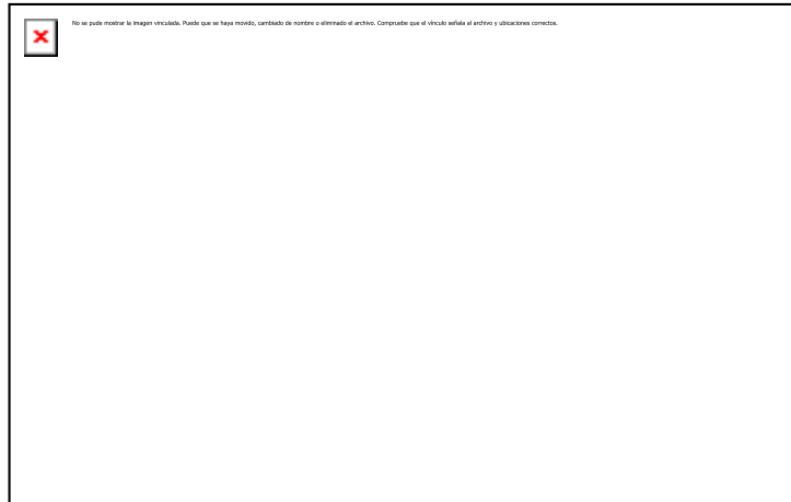
Figura 1. Niveles de comprensión de textos.