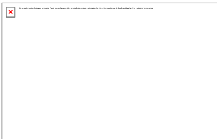
Figura 13. Habitantes en la reserva